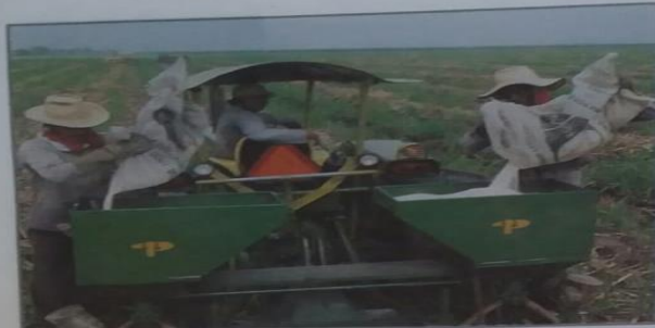
La combinación de los factores de producción permite la obtención de todos los bienes y servicios que requiere una sociedad para su bienestar. ¿Cuáles factores de producción identificas en esta fotografía?